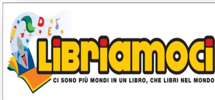
PROMOZIONE DELLA LETTURA