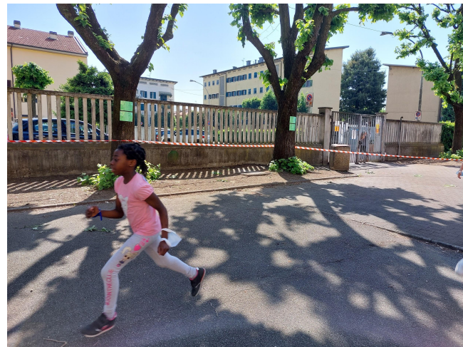
CORSA CONTRO LA FAME