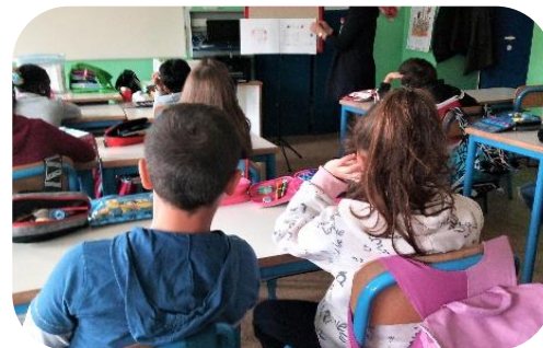
PROGETTO DI EDUCAZIONE ALL'AFFETTIVITÀ